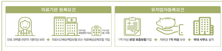
그림 1.2 외국인환자 유치사업 등록요건

- 의료해외진출법(제6조 제1항)은 유치 의료기관 및 유치업자의 등록 요건을 규정